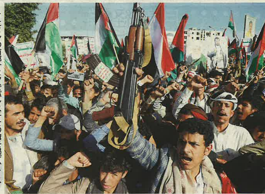
イエメンの首都サヌアでパレスチナの旗を掲げ、イスラエルの攻撃に抗議する市民(13日)

「行動を起こすときが来れば実行に移す。イスラエルを後ろ盾とするレバノンのイスラム教シーア派民兵組織ヒズボラの幹部が13日、首都ベイルートの集会で訴え、ハマスの参戦を示唆した。 ヒズボラは1982年のイスラエルによるレバノン侵攻を機に結成された。イスラエルの「消滅」を掲げており、ガザ危機で存在感を誇示する。ハマスによる7日の奇襲で使われたロケット弾は約3千発だったのに対し、ヒズボラはロケット弾と長距離誘導型ミサイルを計10万発ほど所有しているとの説があり、戦力はハマス以上。2006年にはイスラエルと大規模戦闘を交え、双方で1260人以上の死者を出した。参戦すればイスラエル軍は「正面作戦」を強いられる。